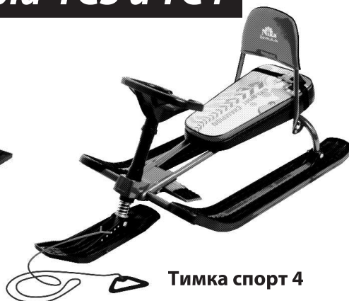
Тимка спорт 4