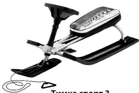
Тимка спорт 3